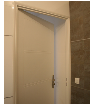
Blocs-portes à parements rainurés

Désormais implanté à Thizy, dans le Rhône, le process de fabrication des produits Menou a été regroupé sur un même lieu : l'Usine 10 du Groupe familial Malerba, 12 000 m 2 dédiés au débit, au profilage et au montage de plus de 2000 blocs-portes par jour. Cet outil industriel ultra-fonctionnel allié au savoir-faire des équipes techniques, permet de conjuguer puissance et réactivité pour fournir des blocs-portes de qualité répondant aux besoins des utilisateurs. Menou représente à ce jour 5% du CA du Groupe familial Malerba ; un pourcentage amené à augmenter dans les prochaines années.